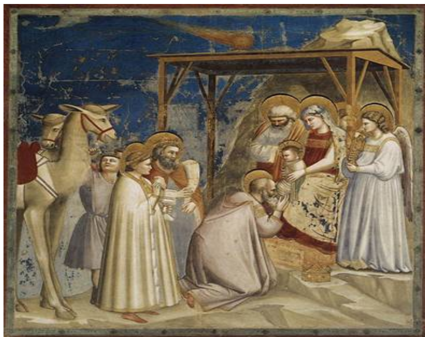
Giotta di Bondone: Klanění tří králů (Padova, kaple Scrovegniů)

TÁBOR, Sezimovo Ústí, Planá nad Lužnicí a Malšice